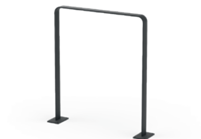
Clean R Fahrradständer zum Einbetonieren, mit Knieholm