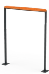
Clean mit Holzauflage zum Aufschrauben