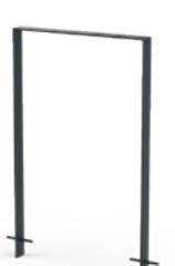
Clean zum Einbetonieren