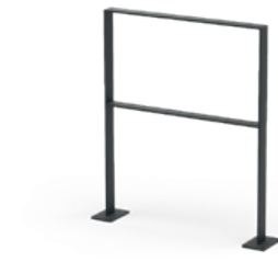
Clean mit Knieholm zum Aufschrauben