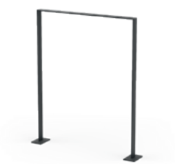
Clean Standardausführung zum Aufschrauben